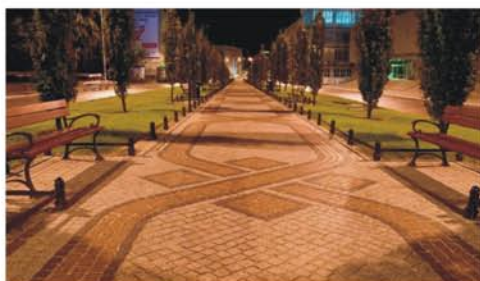
Przebudowa centrum Łaz oraz modernizacja dróg i chodników w sołectwach