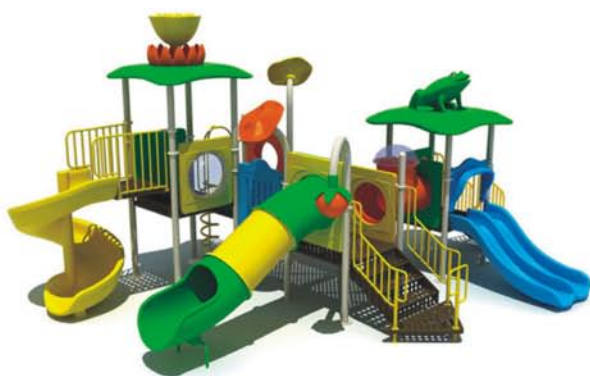
Nowoczesne i estetyczne miejsca odpoczynku dla dzieci i mieszkańców (boiska, place zabaw)