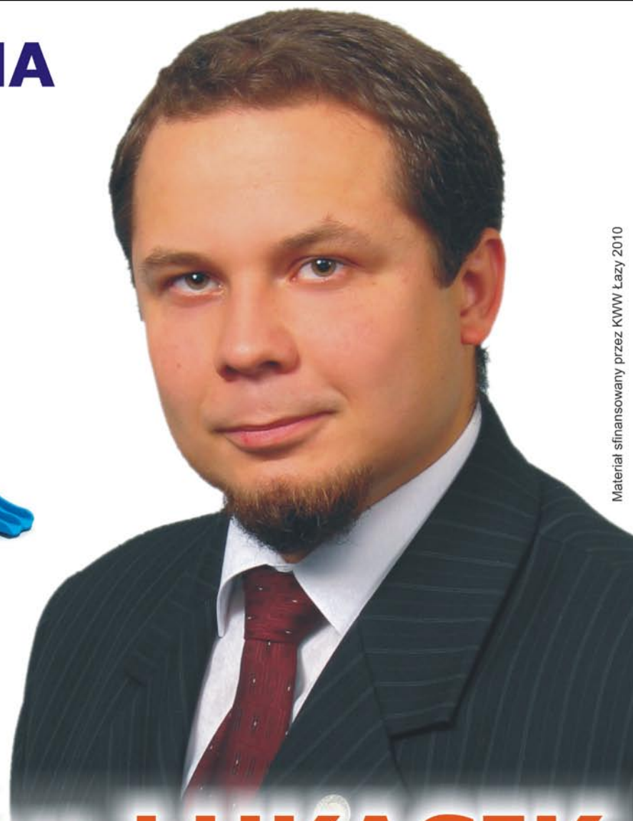
Materiał sfinansowany przez KWW Łazy 2010